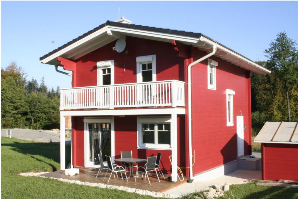
Attraktiv in Design, Leistung und Preis: Kleingarten-Wohnhäuser von AS Haus