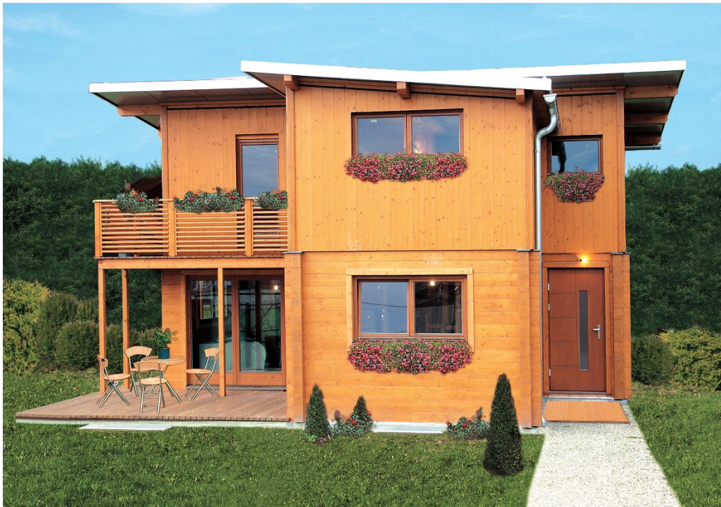
Attraktiv in Design, Leistung und Preis: Kleingarten-Wohnhäuser von AS Haus Symbolfoto

Die vieljährige Erfahrung macht AS Haus zum Spezialisten für den Hausbau im Wiener Kleingarten, selbst auf schwer zugänglichen Parzellen.