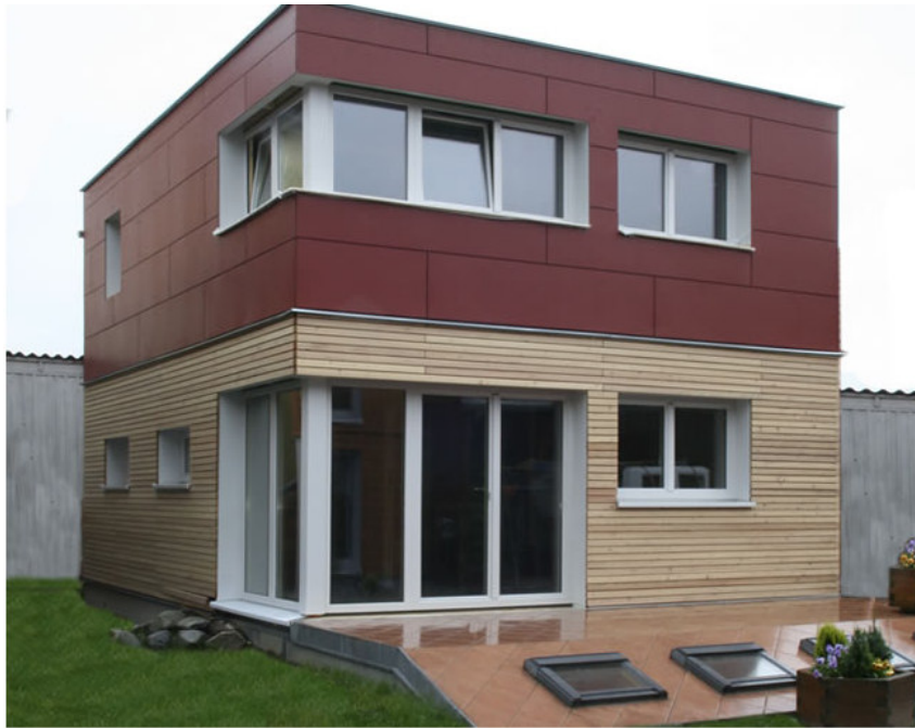
Attraktiv in Design, Leistung und Preis: Kleingarten-Wohnhäuser von AS Haus Symbolfoto

Die vieljährige Erfahrung macht AS Haus zum Spezialisten für den Hausbau im Wiener Kleingarten, selbst auf schwer zugänglichen Parzellen.