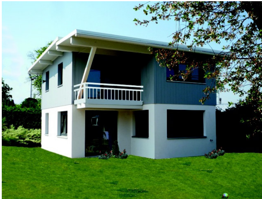
Attraktiv in Design, Leistung und Preis: Kleingarten-Wohnhäuser von AS Haus