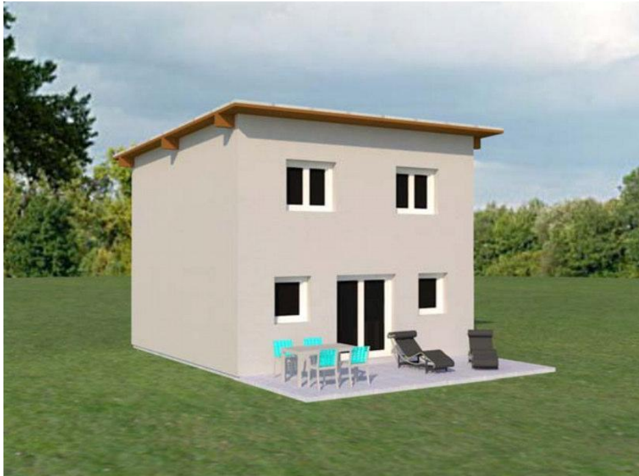
Attraktiv in Design, Leistung und Preis: Kleingarten-Wohnhäuser von AS Haus Symbolfoto

Die vieljährige Erfahrung macht AS Haus zum Spezialisten für den Hausbau im Wiener Kleingarten, selbst auf schwer zugänglichen Parzellen.